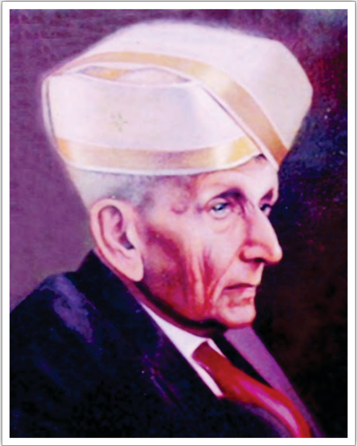
ಸರ್ ಎಂ. ವಿಶ್ವೇಶ್ವರಾಯ